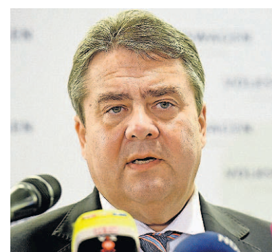
Minister Gabriel warnt vor Hysterie beim TTIP-Abkommen.